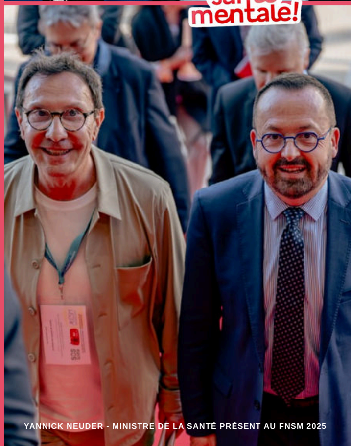
YANNICK NEUDER - MINISTRE DE LA SANTÉ PRÉSENT AU FNSM 2025