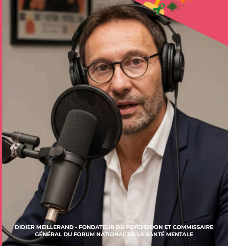
DIDIER MEILLERAND - FONDATEUR DU PSYCHODON ET COMMISSAIRE GÉNÉRAL DU FORUM NATIONAL DE LA SANTÉ MENTALE