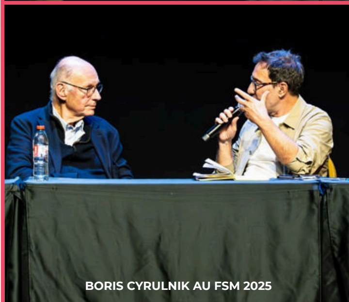
BORIS CYRULNIK AU FSM 2025