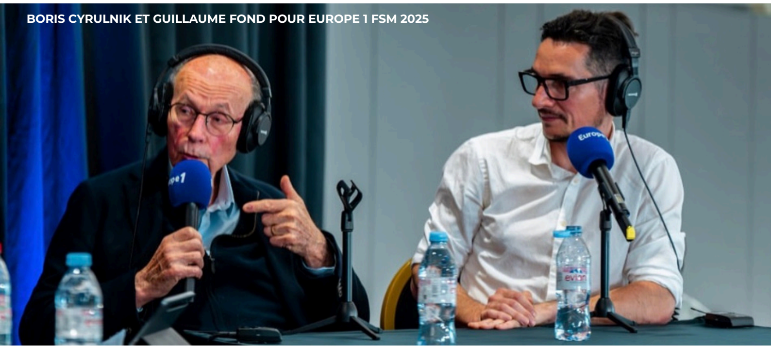
BORIS CYRULNIK ET GUILLAUME FOND POUR EUROPE 1 FSM 2025